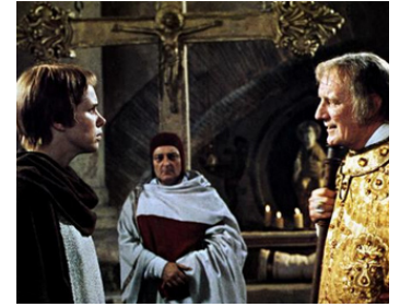
1972 JEANNE, PAPESSE DU DIABLE (Pope Joan) de Michael Anderson avec Liv Ullmann