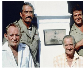
1980 LE COMMANDO DE SA MAJESTÉ (The Sea Wolves) d'A. McLagen avec G. Peck, D. Niven, R. Moore