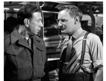
1955 COMMANDO SUR LA GIRONDE (The Cockleshell Heroes) de et avec José Ferrer