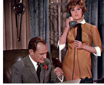
1965 LE LIQUIDATEUR (The Liquidator) de Jack Cardiff avec Jill St. John