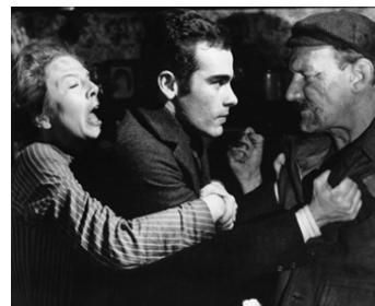
1960 AMANTS ET FILS (Sons and Lovers) de Jack Cardiff avec Wendy Hiller, Dean Stockwell