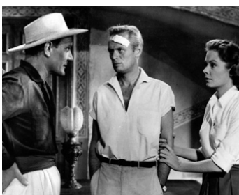
1956 LA COURSE AU SOLEIL (Run for the Sun) de Roy Boulting avec R. Widmark, Jane Greer