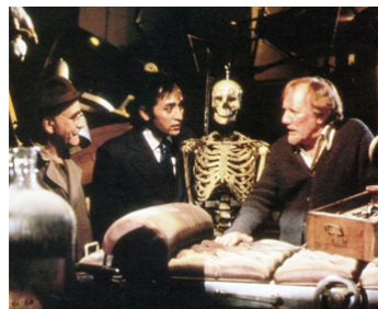
1985 LE SORCIER DE CES DAMES (Foreign Body) de Ronald Neame avec Victor Bannerjee