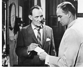
1965 MORITURI (The Saboteur code name: Morituri) de Bernhard Wicki avec Marlon Brando