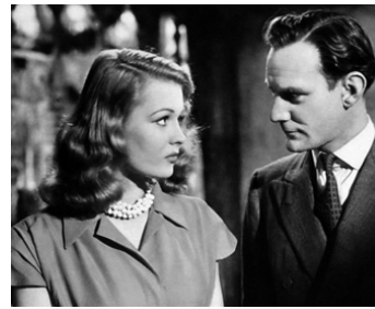
1946 LA COULEUR QUI TUE (Green for Danger) de Frank Launder avec Sally Gray