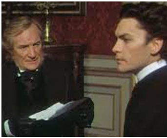
1972 LE CRÉPUSCULE DES DIEUX (Ludwig) de Luchino Visconti avec Helmut Berger