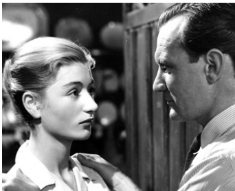
1950 LA SALAMANDRE D'OR (Golden Salamander) de Ronald Neame avec Anouk Aimée