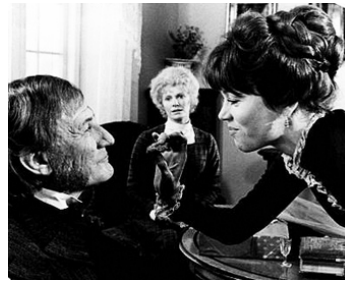
1973 MAISON DE POUPEES (A Doll's House) de J. Losey avec Delphine Seyrig, Jane Fonda