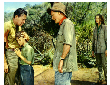
1961 LE LION (The Lion) de Jack Cardiff avec William Holden, Capucine