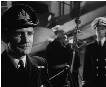
1952 COMMANDO SUR SAINT-NAZAIRE (The Gift Horse) de Compton Bennett