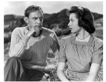
1946 L'ÉTRANGE AVENTURIÈRE (I see a dark Stranger) de Frank Launder avec Deborah Kerr