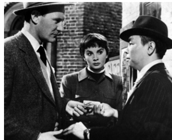
1950 LA FILLE AUX PAPILLONS (The Clouded Yellow) de Ralph Thomas avec Jean Simmons