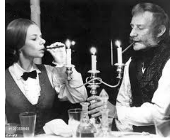
1967 LA CHARGE DE LA BRIGADE LÉGÈRE (The Charge of the Light Brigade) de T. Richardson avec Jill Bennett