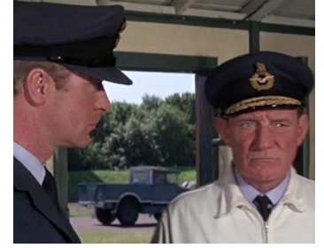
1968 LA BATAILLE D'ANGLETERRE (Battle of Britain) de Guy Hamilton avec Michael Caine