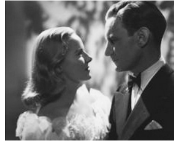
1948 LES AMANTS PASSIONNÉS (The Passionate Friends) de David Lean avec Ann Todd