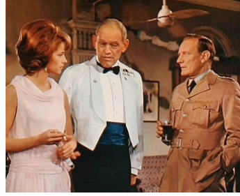
1967 LES TURBANS ROUGES (The long Duel) de Ken Annakin avec Ch. Rampling, H. Andrews