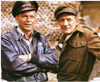
1965 L'EXPRESS DU COLONEL VON RYAN (Von Ryan's Express) de M. Robson avec F. Sinatra