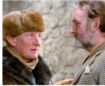
1970 THE NIGHT VISITOR (The Night Visitor) de Laszlo Benedek avec Andrew Keir