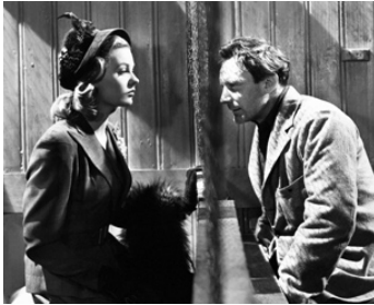
1947 JE SUIS UN FUGITIF (They made me a Fugitive) d'Alberto Cavalcanti avec Sally Gray