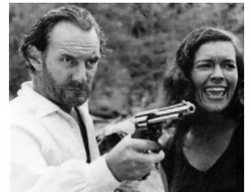
1951 LE BANNI DES ÎLES (Outcast of the Islands) de Carol Reed avec Wendy Hiller