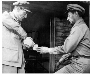
1963 L'AFFAIRE WINSTONE (Man in the Middle) de Guy Hamilton avec Robert Mitchum