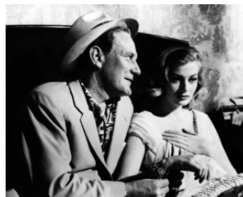
1957 POLICE INTERNATIONALE (Interpol) de John Gilling avec Anita Ekberg