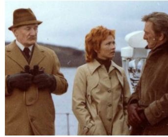
1971 LES DOIGTS CROISÉS (Catch me a Spy) de Dick Clement avec M. Jobert, K. Douglas