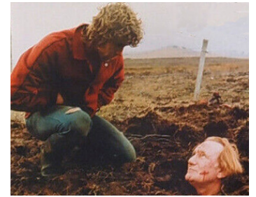
1980 LES ANNÉES LUMIÈRE d'Alain Tanner avec Mick Ford