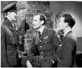
1945 LE CHEMIN DES ÉTOILES (The Way to the Stars) d'A. Asquith avec M. Redgrave, John Mills