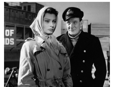
1958 LA CLÉ (The Key) de Carol Reed avec Sophia Loren