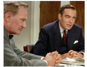
1964 OPÉRATION CROSSBOW (Operation Crossbow) de M. Anderson avec Richard Todd, R. Johnson