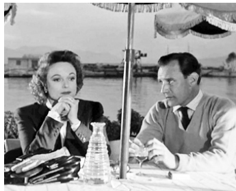
1950 ODETTE AGENT S23 (Odette) de Herbert Wilcox avec Anna Neagle