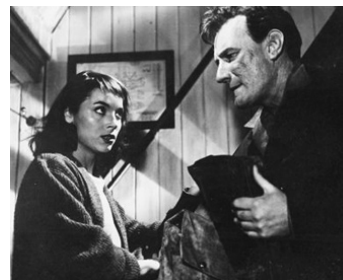
1957 MANUELA, FILLE DE RIEN (Manuela) de Guy Hamilton avec Elsa Martinelli