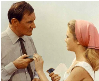
1966 L'HÉRITIÈRE DE SINGAPOUR (Pretty Polly) de Guy Green avec Hayley Mills