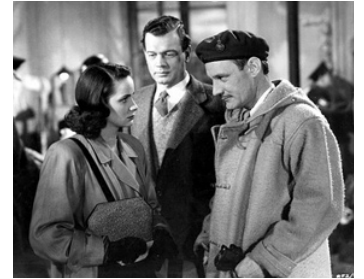
1949 LE TROISIÈME HOMME (The third Man) de Carol Reed avec Joseph Cotten, Alida Valli