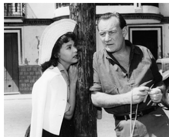
1959 LE CHEMIN DE LA PEUR (Malaga) de Laszlo Benedek avec Dorothy Dandridge