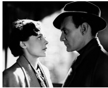
1945 BRÈVE RENCONTRE (Brief Encounter) de David Lean avec Celia Johnson