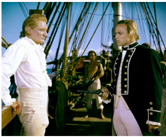
1962 LES RÉVOLTÉS DU BOUNTY (Mutiny on the Bounty) de Lewis Milestone avec Marlon Brando