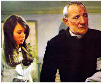
1970 LA FILLE DE RYAN (Ryan's Daughter) de David Lean avec Sarah Miles