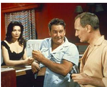
1958 LES RACINES DU CIEL (The Roots of Heaven) de John Huston avec Juliette Greco, Errol Flynn