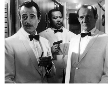
1965 OPÉRATION OPIUM (The Poppy is also a Flower) de T. Young avec Gilbert Roland, Harold Sakata