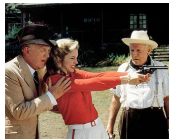
1986 SUR LA ROUTE DE NAIROBI (White Mischief) de M. Radford avec Joss Ackland, Greta Scacchi