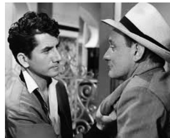
1955 LES AMANTS DU TAGE d'Henri Verneuil avec Daniel Gélin